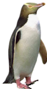
Pinguino Occhi Gialli